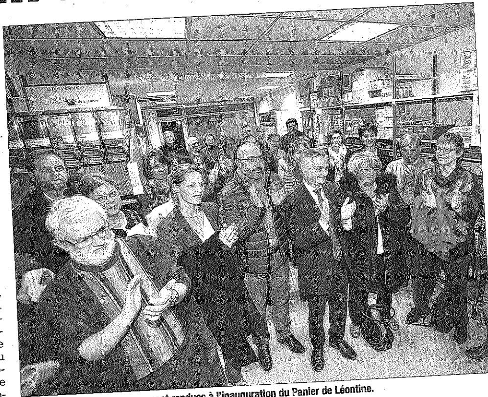
Des dizaines de personnes se sont rendues à l'inauguration du Panier de Léontine. L'épicerie sociale est aussi solidaire depuis janvier.